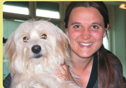
Zipfel mit seiner neuen Besitzerin.

Der kleine Hund hatte ein unwahrscheinliches Glück, dass er nicht innert kurzer Zeit von einem Auto oder Lastwagen überfahren wurde, sondern von einer hilfsbereiten,