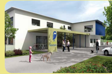
Virtuelle Ansichten des neuen Tierzentrums (Computerbilder)

www.bernertierschutz.ch info@bernertierschutz.ch Spendentelefon: 031 926 64 64, Spendenkonto: PC 30-31879-8