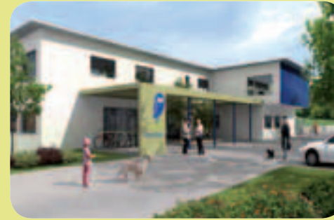
Virtuelle Ansichten des neuen Tierzentrums (Computerbilder)

www.bernertierschutz.ch info@bernertierschutz.ch Spendentelefon: 031 926 64 64, Spendenkonto: PC 30-31879-8