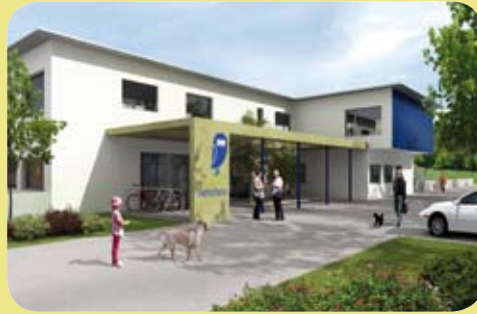
Virtuelle Ansichten des neuen Tierzentrums (Computerbilder)